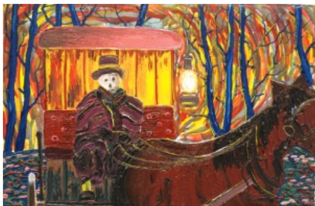
Værk af René Holm

“højteknologisk” våben. Og hvor mon dette våben befinder sig?