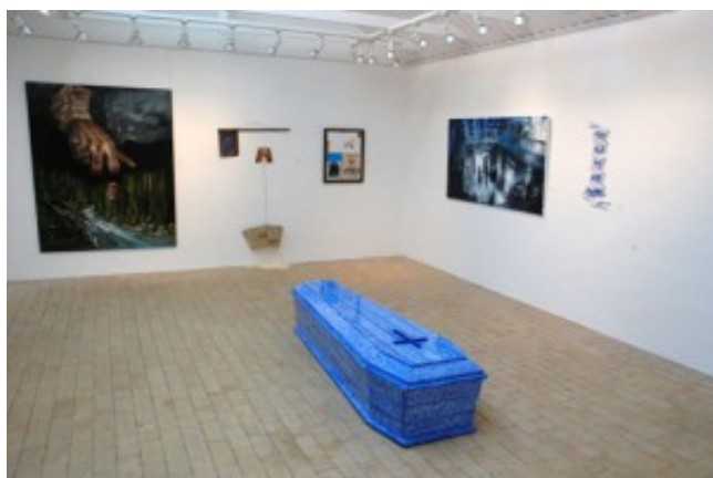
Django – temaudstilling!

Udstillingen er kurateret af galleriets kunstner René Holm, som har formået at få anerkendte kunstnere fra USA, Tyskland, Belgien og Danmark til hver på deres måde at lave værker over Django – der er en figur i flere spaghetti-western.